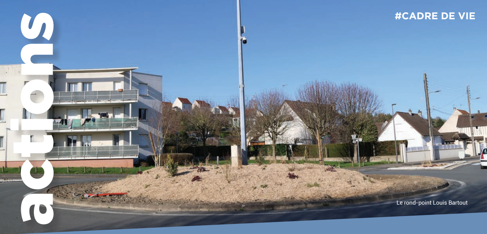
Le rond-point Louis Bartout