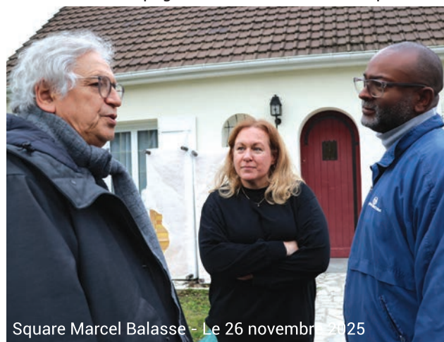
Square Marcel Balasse - Le 26 novembre 2025

La démocratie participative n'est pas un vain mot à Margny. Les élus, accompagnés des services municipaux, se