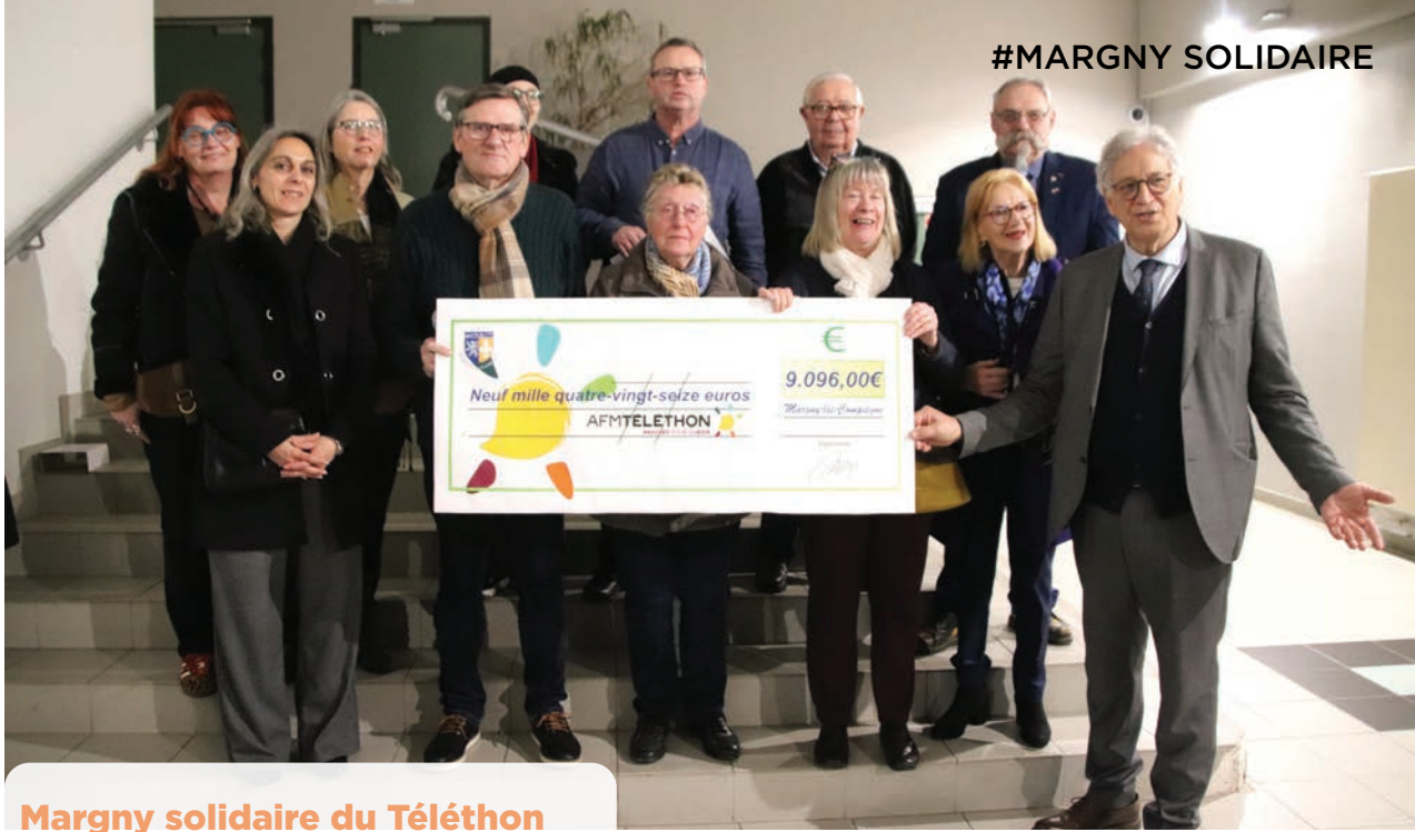
Margny solidaire du Téléthon

Un chèque de 9 096,00 € a été remis le 14 janvier à l'AFM Téléthon. Ces fonds permettront d'aider à la lutte contre les maladies rares, d'être aux côtés des familles et des chercheurs.