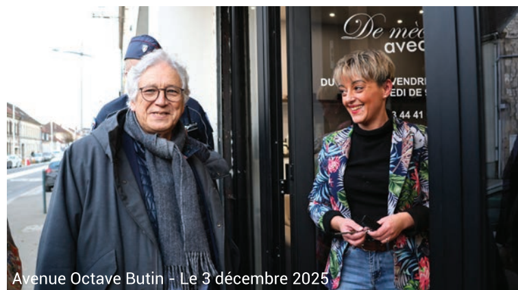
Avenue Octave Butin - Le 3 décembre 2025

déplacent régulièrement dans votre quartier pour aller à votre rencontre et échanger sur vos besoins et vos attentes.